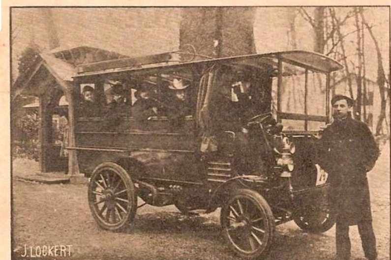
Omnibus 12 chevaux de Dietrich & Co, faisant le service régulier entre Lunéville et Blâmont Usine à Lunéville. — Bureaux à Paris, 25, rue Brunel.

On lit couramment que la première ligne d'autobus date de 1906... à Paris ! Mais il est très probable que la première ligne régulière soit en réalité la ligne Lunéville-Blâmont de 1902. Car dès 1901, la Société De Dietrich fabrique, dans son usine de Lunéville, de petits omnibus à essence, actionnés par des moteurs Bollée, d'une puissance de 12 ch, qui peuvent transporter 12 personnes en intérieur (et 2 à côté du chauffeur). Pour tester son matériel, la société organise, dès le 27 janvier 1902, un service public régulier de transport de voyageurs et de dépêches, où deux omnibus assurent quatre départs par jour simultanément, de Lunéville et de Blâmont (7h20, 10h20, 13h et 16h), desservant en deux heures Croismare, Marainviller, Thiébauménil, Bénaménil, Ogéville, Herbéville et Domèvre. A cette époque, le chemin de fer de Lunéville à Blâmont (LBB), pourtant déjà projeté, attendra encore neuf années pour être inauguré. Et l'expérience de 1902, citée immédiatement en exemple par la presse française et étrangère, constitue certainement le premier service régulier d'autobus organisé en France.