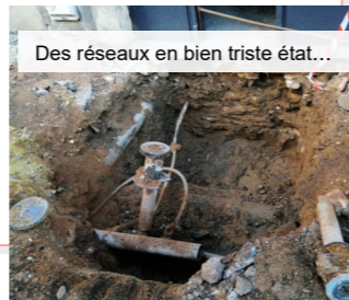
Des réseaux en bien triste état...

Laborieux ! Il n'y a guère d'autre adjectif pour désigner ces travaux qui ont pris bien du retard sur le calendrier prévu : difficultés de recrutement de l'entreprise, améliorations en cours de chantier (place du Général de Gaulle par exemple), problématique de circulation constante et adaptation à des réseaux particulièrement dégradés, ont considérablement rallongé les délais d'exécution. Impossible toutefois d'en relater l'évolution dans les différents bulletins, puisqu'entre leurs mises à l'impression et leurs distributions, de nouvelles étapes ont à chaque fois été franchies. Il reste bien évidemment à réaliser les marquages (places, passages protégés...), la pose du mobilier urbain (quilles, boules, etc...), et dès le retour des beaux jours, la réfection complète du tapis routier par le Département. Et enfin, la rue du 18 Novembre aura repris un aspect plus convivial, avec de vrais espaces de stationnement, des réseaux rénovés, et une mise au normes des cheminements piétons.