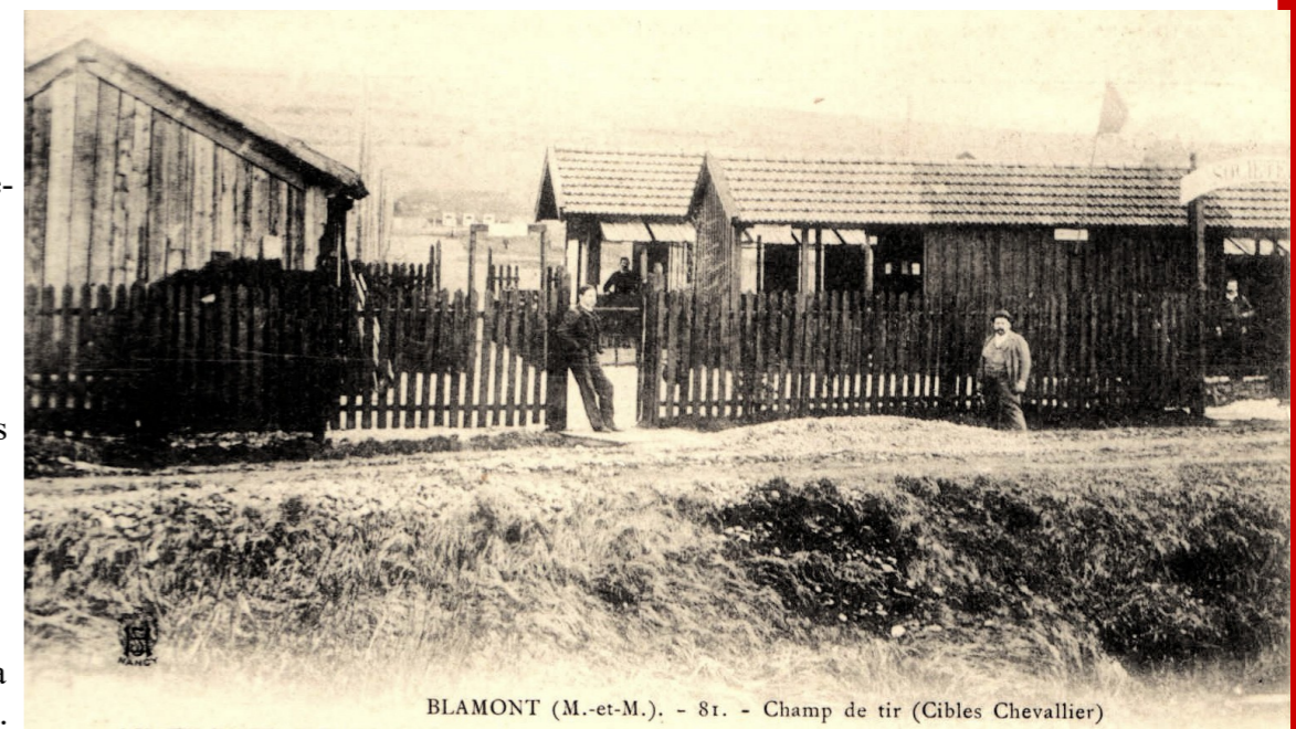
BLAMONT (M.-et-M.). - 81. - Champ de tir (Cibles Chevallier)

installer, en avril 1912 des aménagements de sécurité sur le champ de tir. Cela n'empêchera pas le développement jusqu'à la guerre de la Société de Tir de Blâmont-Cirey (d'autant que depuis 1907, on organise dans les écoles de 42 communes locales, l'enseignement du tir pour les enfants de 10 à 13 ans, sur le même plan que la gymnastique).