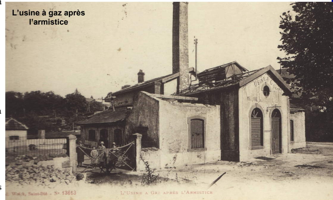
L'usine à gaz après l'armistice

Sur cette photographie (1919 ?) de l'usine à gaz, on reconnaît aisément à sa lucarne ronde, le bâtiment toujours existant rue de Voise (ancienne communauté de communes). Si les premières expériences d'éclairage public au gaz datent du début du XIX ème siècle (avec, par exemple, remplacement à Paris des becs à huile par des réverbères à gaz de 1830 à 1850), ce n'est qu'en 1867 que les frères Hendricks, ingénieurs à Pont-à-Mousson, obtiennent une concession pour l'éclairage de la ville de Blâmont. Un bail est signé pour un terrain communal en bordure de Voise, où sont construites les cornues à gaz pour distillation de la houille, avec cloche de stockage. Les deux premiers réverbères apparaissent en 1869 sur la place de l'hôtel de ville, puis au collège et à l'école de garçon. L'entreprise de gaz est alors gérée par M. Bailly : bien qu'il se porte acquéreur lors de la mise en vente de l'usine en 1896, le gestionnaire devient Joseph Kissel. Mais, c'est au final, le nancéen Antoine Berthelon, alors âgé de 30 ans, qui achète à la commune l'usine (1897), puis le terrain de 12 ares (1898) pour y développer l'activité. Il y réside avec sa famille (son épouse, ses 4 enfants et sa mère), jusqu'à ce qu'il se consacre au projet de l'éclairage au gaz de Baccarat (1907 - construction 1909), et laisse direction et habitation à Jules Génot.