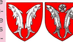
Henri 1er Henri IV Comtes de Blâmont