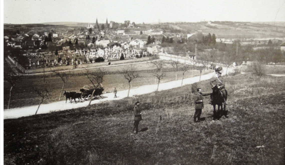
Blâmont en 1917

Nous essayerons au fil des publications d'insérer des documents photographiques ou des cartes postales anciennes peu connus.